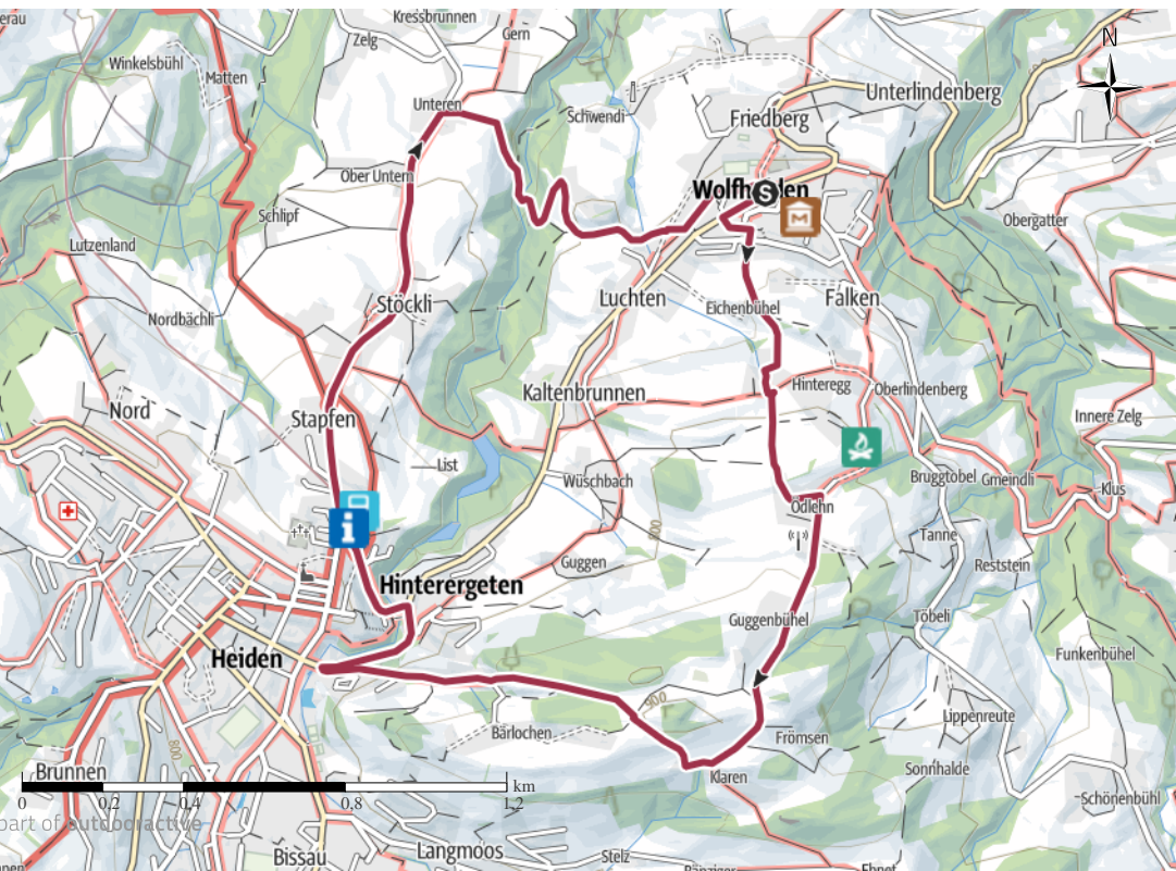
Kartengrundlagen: outdooractive kartografie; OpenStreetMap (www.openstreetmap.org) Geodaten © swisstopo

QR-Code scannen und diese Tour offline speichern, mit Freunden teilen und mehr.