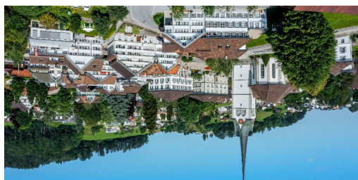
TOP Kulturpfad Teufen Themenweg