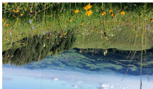
Die Aussicht auf die Gemeinde Urnäsch von der Hochalp.