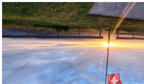
Die Schweizer Fahne und ein traumhafter Sonnenaufgang auf der Hochalp.