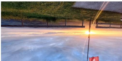
TOP Weitblicke von der Hochalp