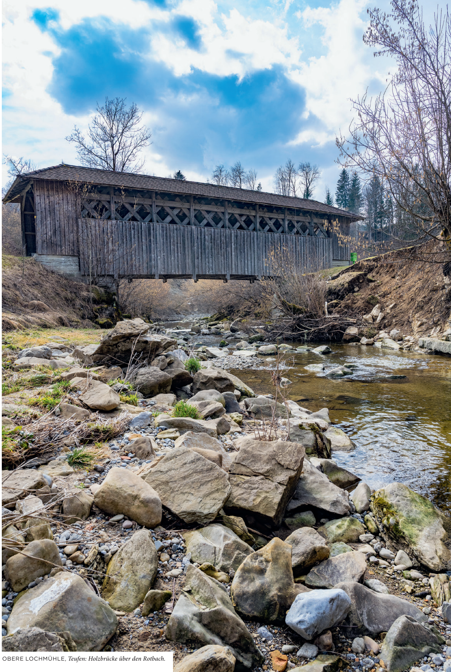
OBERE LOCHMÜHLE, Teufen: Holzbrücke über den Rotbach.