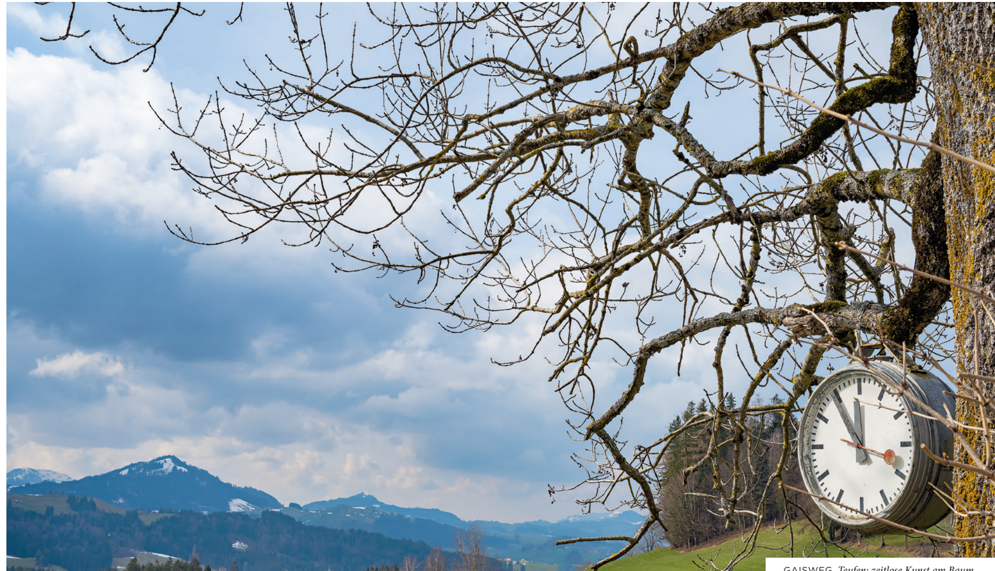
GAISWEG, Teufen: zeitlose Kunst am Baum.