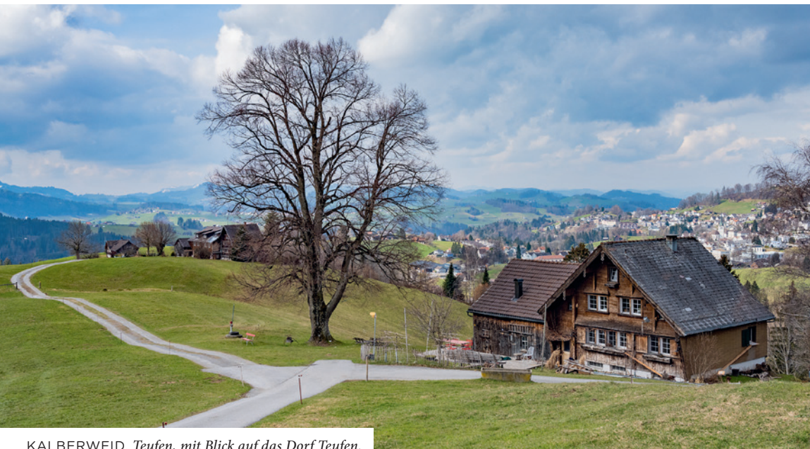
KALBERWEID, Teufen, mit Blick auf das Dorf Teufen.