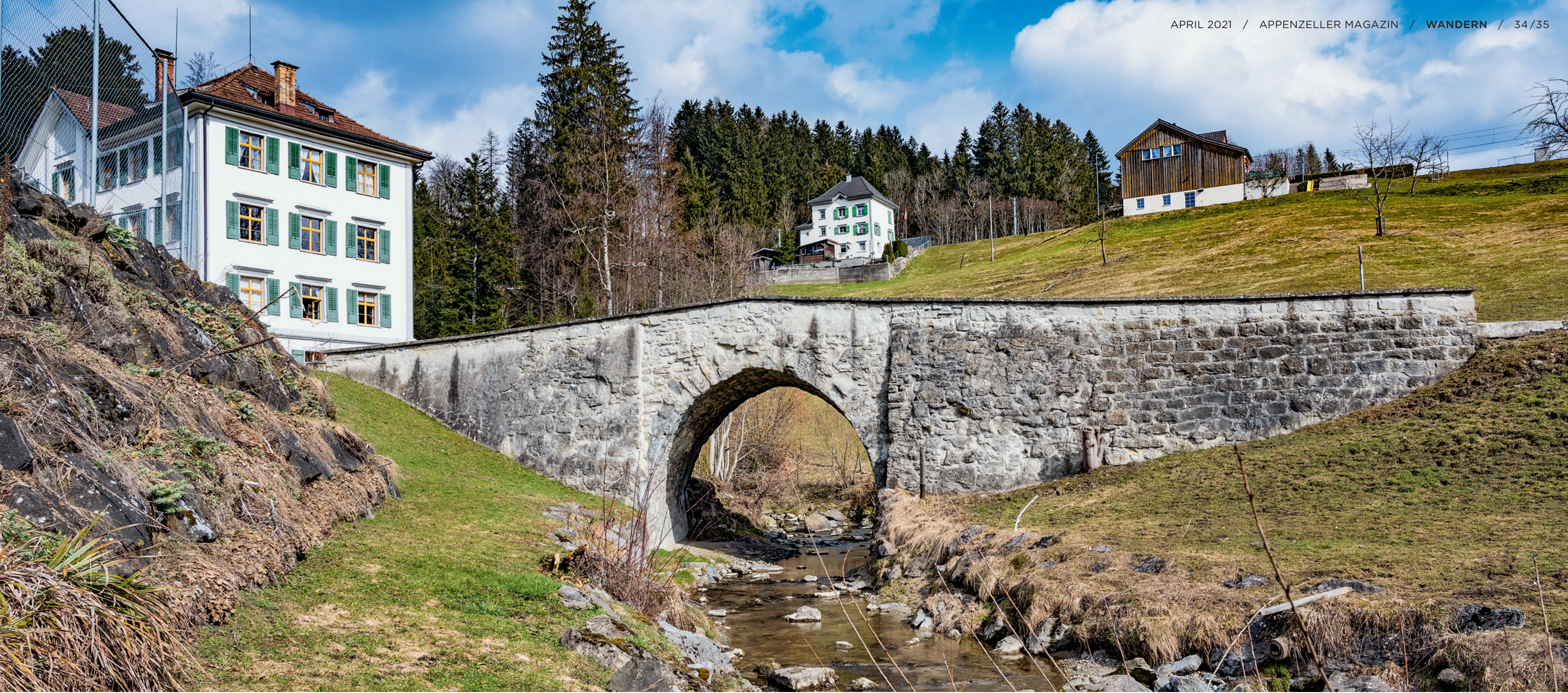
UNTERER SAMMELBÜEL, Teufen: Unter der Brücke fließt der Goldibach.