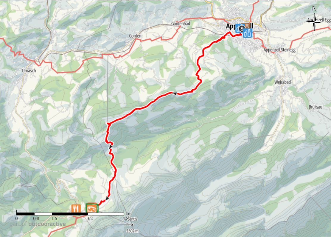
part of outdooractive

Kartengrundlagen: outdooractive kartografi; ©OpenStreetMap (www.openstreetmap.org) Geodaten © swisstopo