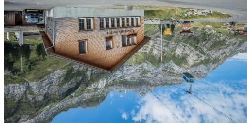
TOP Am Fusse des Säntis