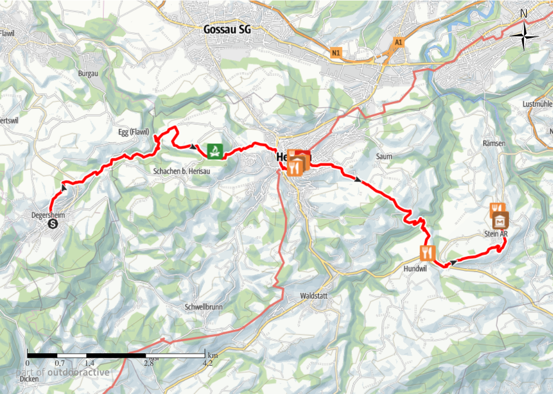
Foto: Jana Bacher, Appenzellerland Tourismus AR Kartengrundlagen: outdooractive Kartografie; OpenStreetMap (www.openstreetmap.org) Geodaten © swisstopo