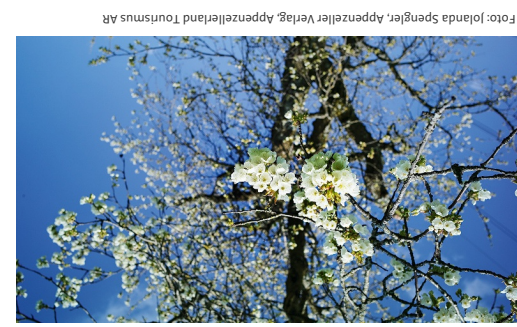
In der Nordhalde