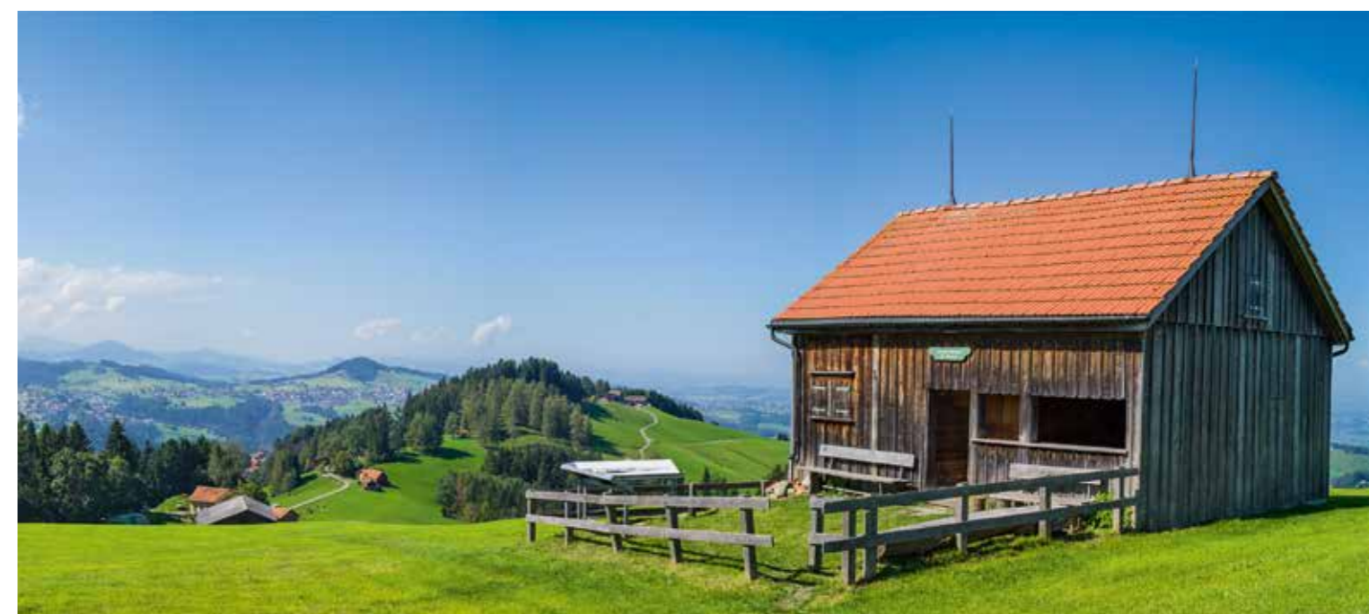
RUEHÜSLI Stobetebüel beim Kaien.

Abwechslungsreich ist die Route auf jeden Fall. Über grüne Wiesen und durch den kühlen Wald geht es immer auf und ab – so wie man es vom Appenzellerland kennt. Als Geheimtipp für Pilzler gilt der Tannenbüeler Wald beim Krönli. Da lässt sich eine Vielfalt an Pilzen finden, und mancherorts wachsen auch Beeren am Waldrand. Kurz nach dem Kaienspitz steht das auffällig rote Kaienhaus der Naturfreunde Sektion Rorschach direkt am Waldrand. Am Wochenende ist das Naturfreundehaus jeweils bewirtet.