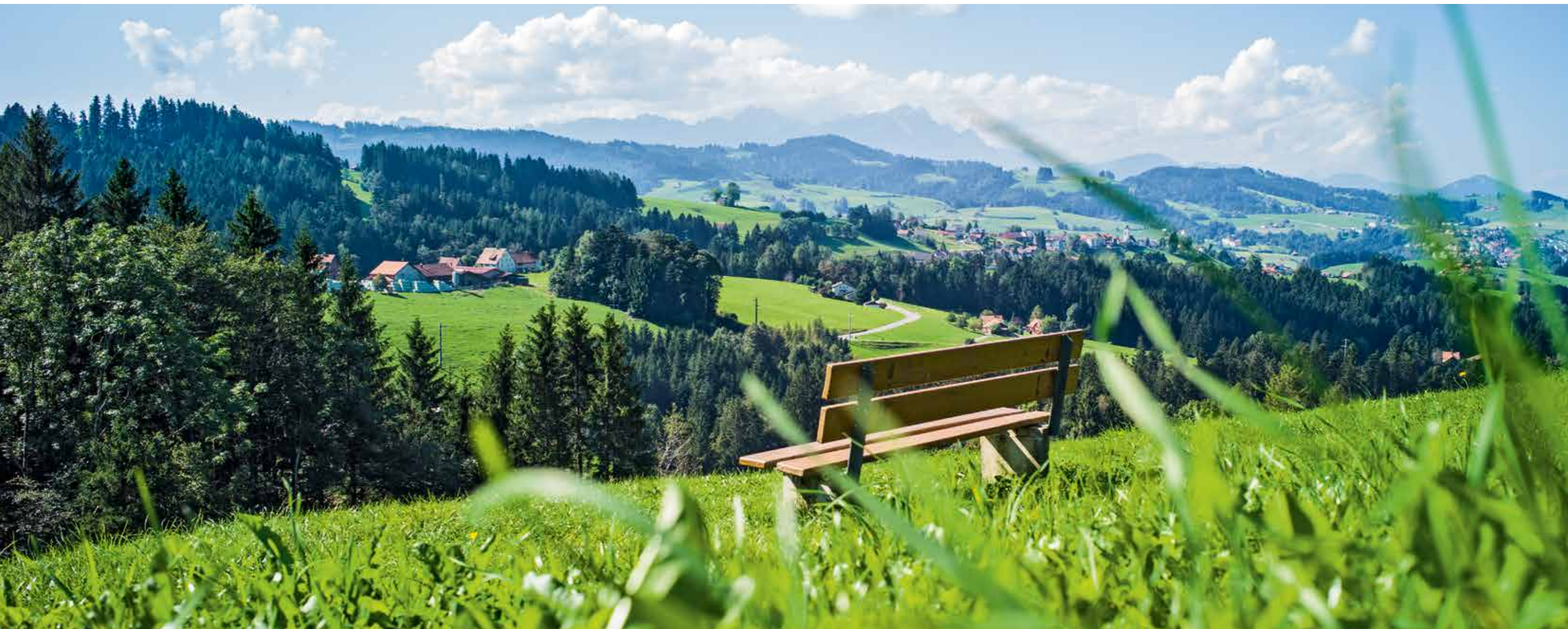
LANGENEGG: Ausblick Richtung Alpstein.